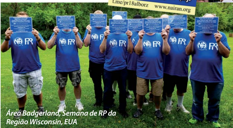
Área Badgerland, Semana de RP da Região Wisconsin, EUA