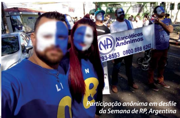
Participação anônima em desfile da Semana de RP, Argentina

Os objetivos básicos dos nossos Serviços Mundiais são a comunicação, coordenação, informação e orientação. Proporcionamos esses serviços para que nossos grupos e membros possam levar a mensagem de recuperação com maior sucesso, e para que nosso programa de recuperação seja mais acessível aos adictos de todos os lugares.