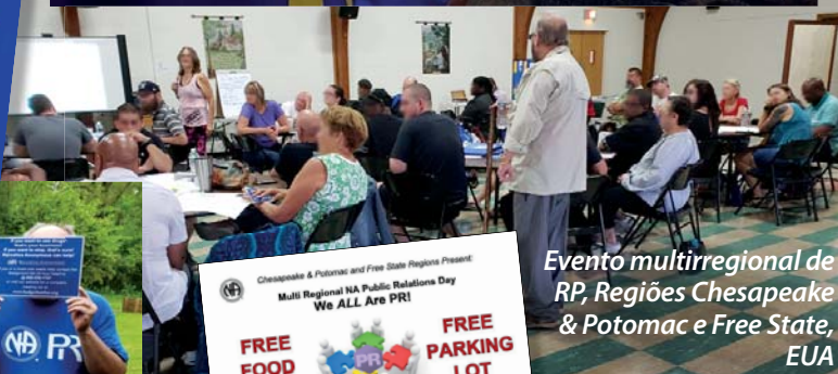
Evento multirregional de RP, Regiões Chesapeake & Potomac e Free State, EUA